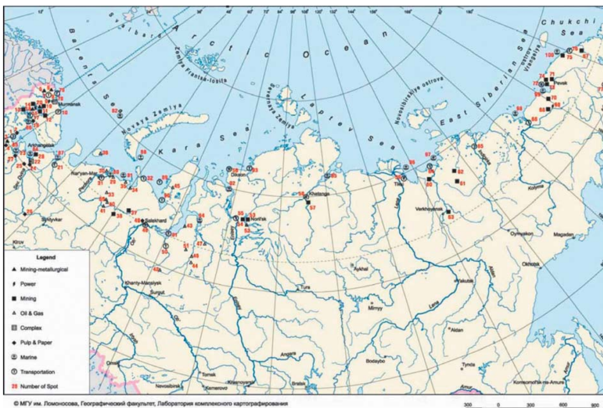
Рис. 1. Карта «горячих точек» российской Арктики (географический факультет МГУ им. М. В. Ломоносова)